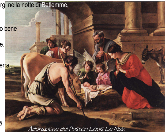
Adorazione dei Pastori Louis Le Nain